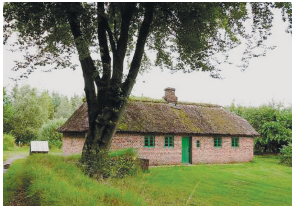
Rakkerhuset i Bjørnemosen